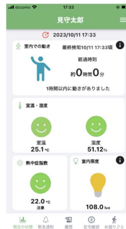
アプリ画面イメージ